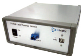
ファイバ出力モデル